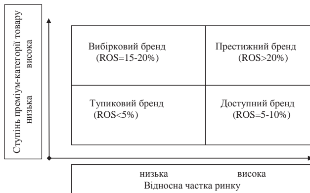
Рис. 3. Матриця позиціонування бренду [8, с. 158]

вище ступінь престижності товару, тим вище рівень прибутковості.