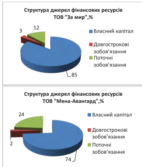
Рис. 3. Структура джерел фінансових ресурсів господарств за 2014 р.

Наочно структуру джерел фінансових ресурсів господарств можна зазначити графічно за допомогою рис. 3: