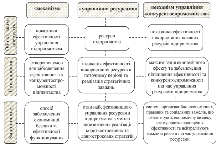
Рис. 3. Семантична характеристика поняття «механізм управління конкурентоспроможністю»

Наведені дані надають можливість встановлення логічного зв'язку між дефініціями «механізм» та «управління ресурсами підприємства», що виражається в їх послідовній залежності, тобто останнє є похідним від попереднього. Своєю чергою, механізм є інструментом досягнення максимальної ефективності під час управління ресурсами агроформувань.