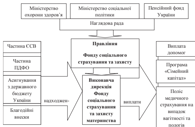
Рис. 1. Схема функціонування Фонду соціального страхування та захисту материнства в Україні