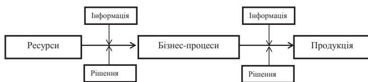
Рис. 1. Лінійна інформаційна модель підприємства

Утворення центрів інформації вимагає чіткої структуризації організаційної моделі підприємства, яка забезпечує ефективну господарську діяльність. Як організаційну модель підприємства слід розуміти спеціальну форму зображення зв'язків, правил, що