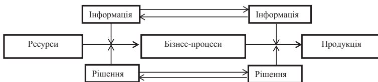
Рис. 2. Інтерактивна інформаційна модель підприємства