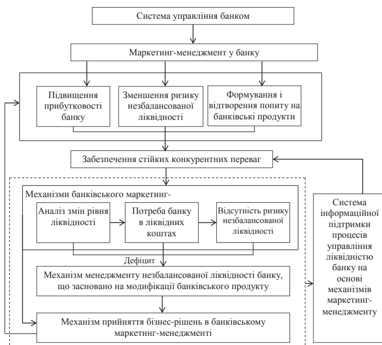
Рис. 1. Концепція синтезу механізмів маркетинг-менеджменту в управлінні ліквідністю банку

Потреба в інтеграції маркетингу й менеджменту як ефективного підходу до організації банківської діяльності, що забезпечує підвищення стійкості банків до