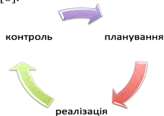
Рис. 2. Зворотний зв'язку, який дозволяє своєчасно вносити корективи у процес здійснення реструктуризації

Також треба зазначити, що саме криза створює об'єктивні передумови для якісних змін в економіці й суспільно-політичному житті країни, визначаючи необхідність реформ, реструктуризації економіки на основі інноваційних процесів і новітніх технологій [8].