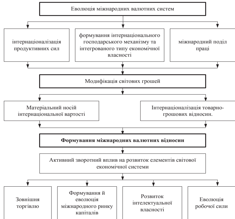
Рис. 1. Еволюція розвитку міжнародних валютних відносин

Зростання вагомості валютної системи примушує промислово-розвинені країни вдосконалювати наявні та шукати нові інструменти та методи державно-монополістичного регулювання валютної сфери на різних рівнях.