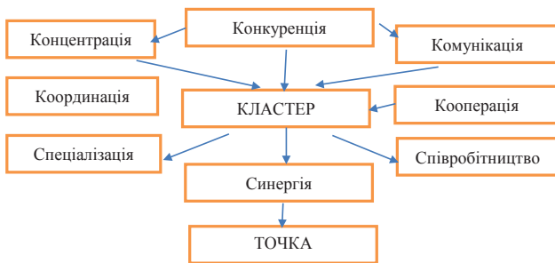
Рис. 2. Складники успішної діяльності кластерів

Дослідження М. Войнаренко [2] показують, що формування кластерних моделей в економіці знаходиться у межах двох зон – формування кластерів – три «К» та підтримка кластерів – три «С» (див. рис. 2). Перша зона впливає на утворення кластерів, включає концентрацію, комунікацію і конкуренцію, а друга сприяє якісним змінам у результаті створення кластерів та включає спеціалізацію, співпрацю і синергію. Концентрація примножує зусилля перерахованих факторів для забезпечення провідних позицій галузі в регіоні та створенню передумов для виникнення полюсів зростання. Комунікація передбачає регулярний обмін інформацією між постійними учасниками кластерних об'єднань. Дуже важливе місце займає конкуренція як економічне суперництво та боротьба між підприємницькими структурами (виробниками продукції), у тому числі посередниками, за найбільш вигідні умови виробництва та збуту продукції (товарів і послуг), а особливо за отримання максимального прибутку від економічної (фінансово-господарської) діяльності.