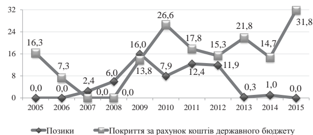
Рис. 2. Джерела покриття дефіциту Пенсійного фонду України, млрд грн

Зазначимо, що дефіцит Пенсійного фонду України на 2016 р. затверджено в розмірі 81,3 млрд грн.