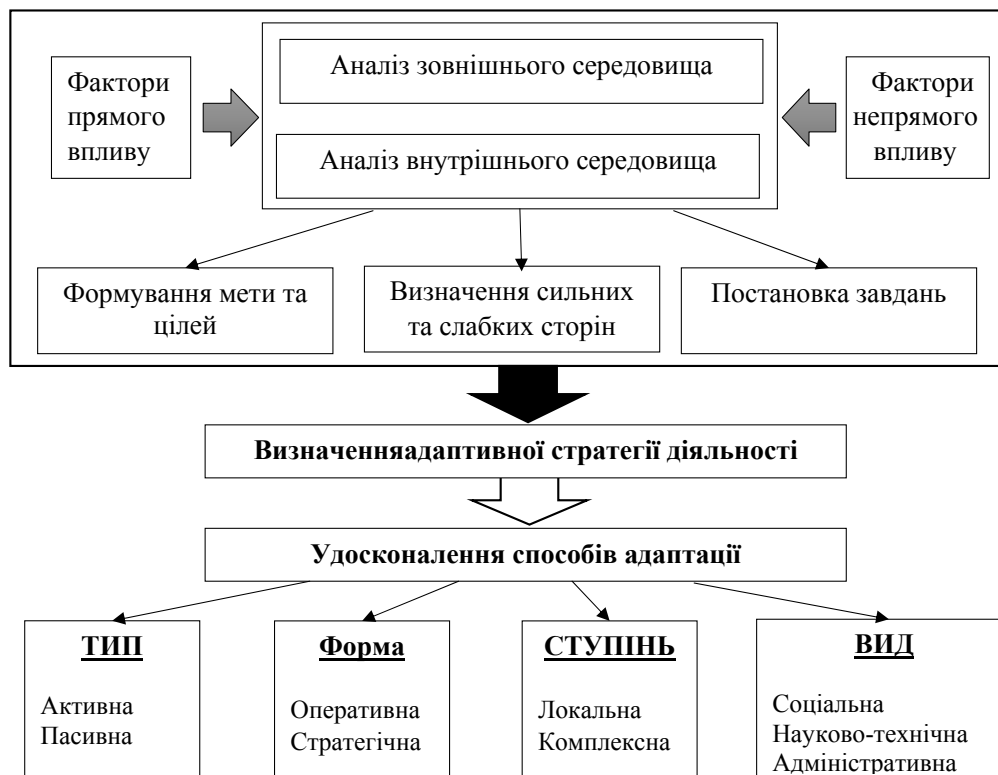
Рис. 1. Механізм діяльності підприємств харчової промисловості в умовах нестабільного бізнес-середовища

Важливим зовнішнім фактором впливу є державна політика України в галузі харчової промисловості, яка полягає у формуванні законодавчої і нормативної бази: удосконалення нормативної і законодавчої бази, яка регулює виробництво, зберігання,