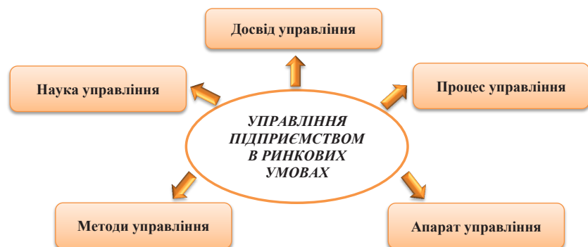
Рис. 1. Основні підходи до визначення сутності процесу управління підприємством у ринкових умовах господарювання [5]

На думку більшості спеціалістів, складовими менеджменту є теорія управління, мистецтво управління і практичний досвід управління. Менеджмент можна розглядати як єдине ціле, що складається з елементів. Такими частинами є мета і принципи менеджменту, функції управління, методи менеджменту, кадрові менеджерів, структура управління бізнесом, техніка і технологія управління, інформація в менеджменті.