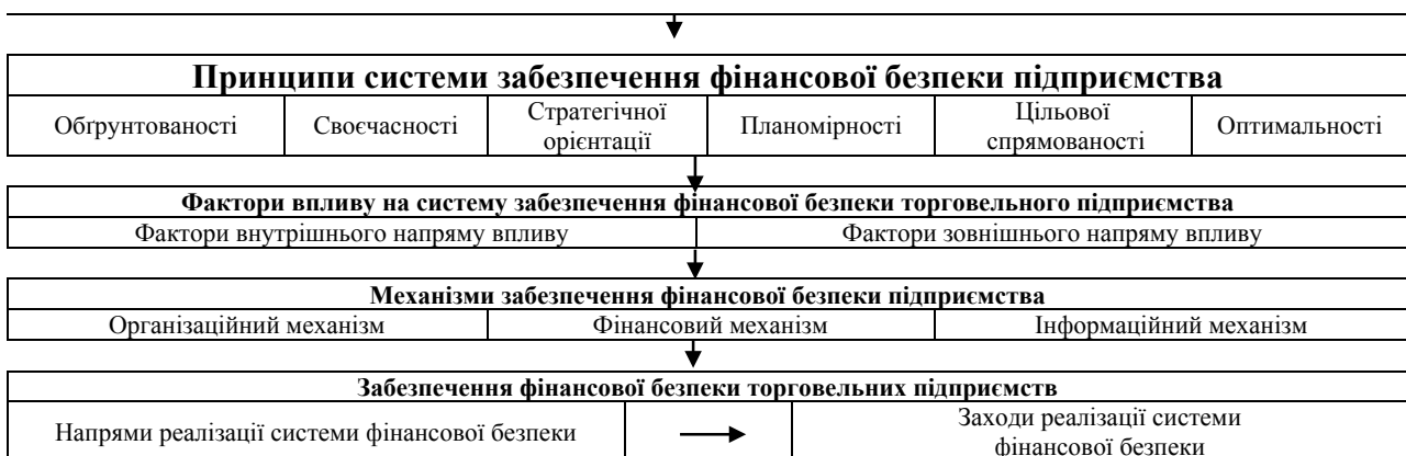
Рис. 1. Концепція системи забезпечення фінансової безпеки торговельного підприємства

Сукупність чинників впливу на систему забезпечення фінансової безпеки визначають механізми системи фінансової безпеки підприємств. Створення та функціонування системи фінансової безпеки вимагає розробки та реалізації основних механізмів, а саме: організаційного механізму системи фінансової безпеки торговельних підприємств; фінансового меха-