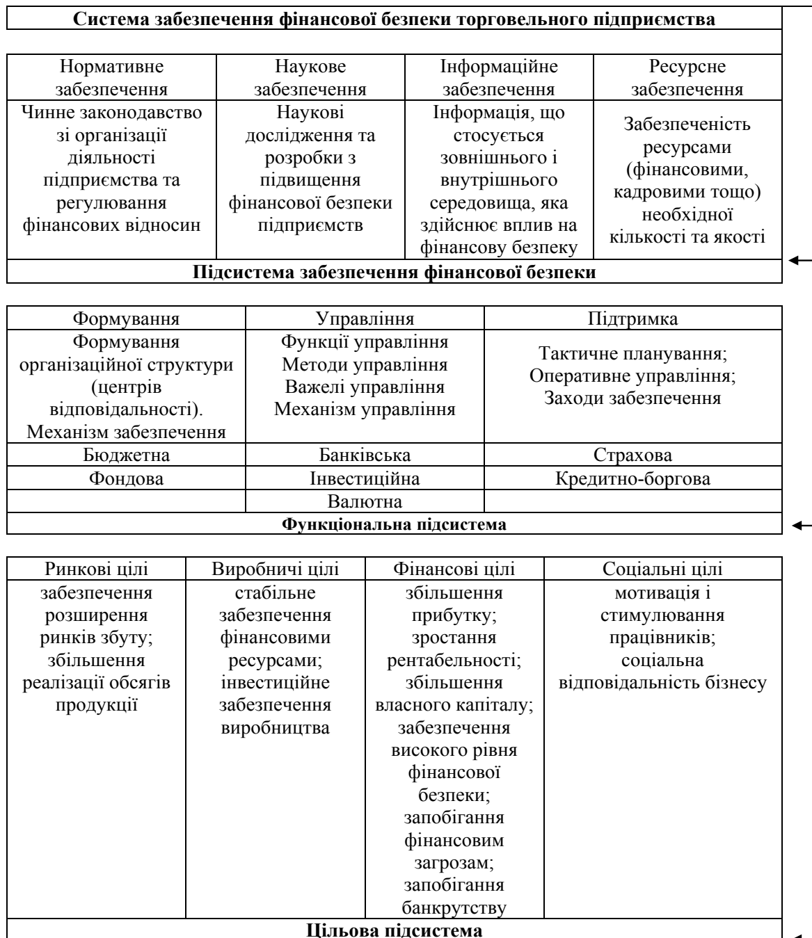
Рис. 3. Основні підсистеми забезпечення фінансової безпеки торговельного підприємства

Наукове забезпечення системи фінансової безпеки підприємств містить наукові підходи, розробки, дослідження, поширення зв'язків між науковцями