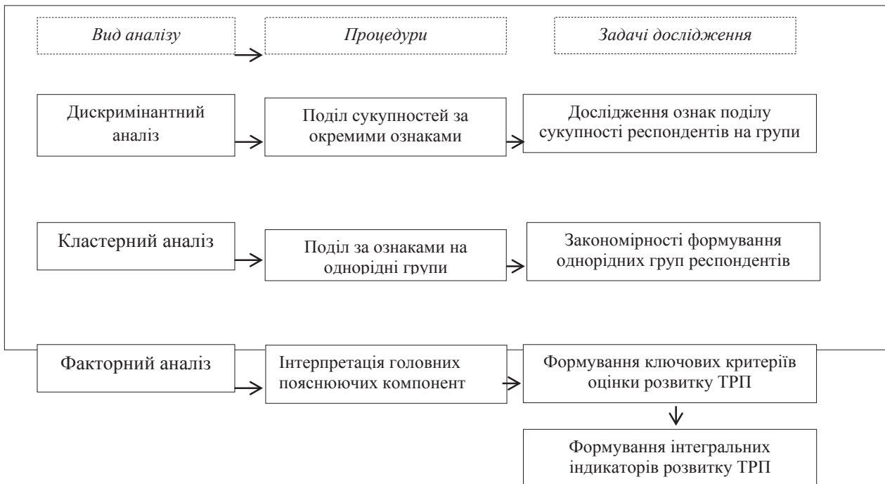
Рис. 2. Послідовність багатомірного аналізу та інтерпретації даних в ході інтегральної оцінки ТРП Херсонської області

Більша кількість ознак під час оцінювання туристично-рекреаційного потенціалу носить якісний характер. Описати такі показники можна лише за допомогою лінгвістичних змінних, які розробляються за допомогою методів зниження розмірності даних. Проведено факторний багатомірний аналіз, в ході якого виокремлено 11 головних компонент, які пояснюють 77,3% загальної дисперсії. Застосовано критерій «каменистого сипу», що полягає у пошуку точки, де убування власних значень уповільнюється найбільш сильно. Такою точкою розриву можна визнати три фактори, що пояснюють 40,2% досліджуваної сукупності. Перший фактор об'єднав показники оцінки соціально-економічних передумов організації туристичної діяльності у регіоні (19,6% загальної дисперсії), його позначено як фактор «Матеріальний добробут сім'ї» (табл. 2). Виходячи з оцінок результатів дослідження, можна сказати, що показник сімейного стану має найбільшу кореляцію з першим фактором. Сімейний добробут є одним з визначних імперативів серед статистичних показників добробуту населення, що яскраво вира-