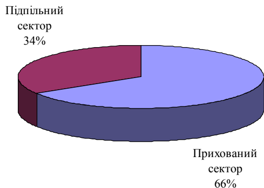
Рис. 3. Агрегована структура тіньової економіки України

Агреговану структуру тіньової економіки на макроекономічному рівні розглядаємо як бінарну, що складається із прихованого («сірого») та підпільного («чорного») секторів. Домінування прихованої складової тіньової економіки є спільним явищем для багатьох країн, про що зазначають у своїх дослідженнях ряд іноземних вчених [2; 13]. Вважаємо, що на макrorівні оптимальною є структура тіньової економіки, яка відповідає за секторами «пропорції Парето»: 80/20. На рис. 3 зазначена нинішня агрегована структура тіньової економіки України за власною оцінкою автора.