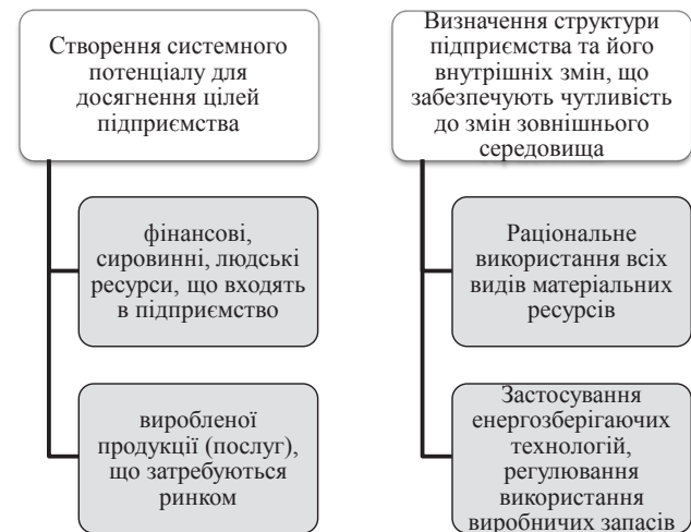
Рис. 4. Результати діяльності підприємства внаслідок використання системи стратегічного управління підприємством

Одним із першочергових завдань керівництва є також поліпшення системи планування, обліку і контролю за основними показниками діяльності підприємства. Це можна реалізувати за допомогою впровадження ефективної системи внутрішнього контролю, широкого і всебічного впровадження обчислювальної техніки, розвитку комп'ютерних мереж зв'язку, застосування сучасних програмних засобів: технологій управління та інформаційних технологій [1, с. 216]. Такий напрям вдосконалення системи управління як стратегічне планування вносить суттєві корективи в методи управління, визначаючи план розвитку на майбутнє, рис. 4.