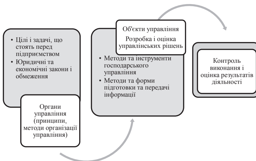
Рис. 2. Функціональний механізм формування системи управління підприємством