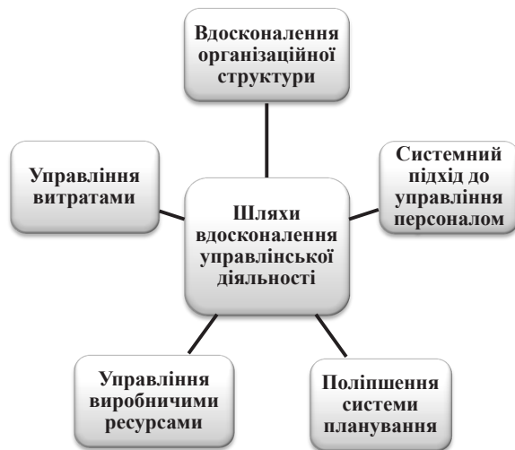
Рис. 3. Основні напрями ефективної діяльності підприємства

Основні можливості для вдосконалення управлінської системи необхідно шукати не в спробах модернізації існуючої системи та не у використанні поліпшувачих інновацій, а в упровадженні нововведень та інноваційних підходів до управління діяльністю підприємства. Шляхи вдосконалення управлінської діяльності повинні включати всі аспекти діяльності підприємства (рис. 1).