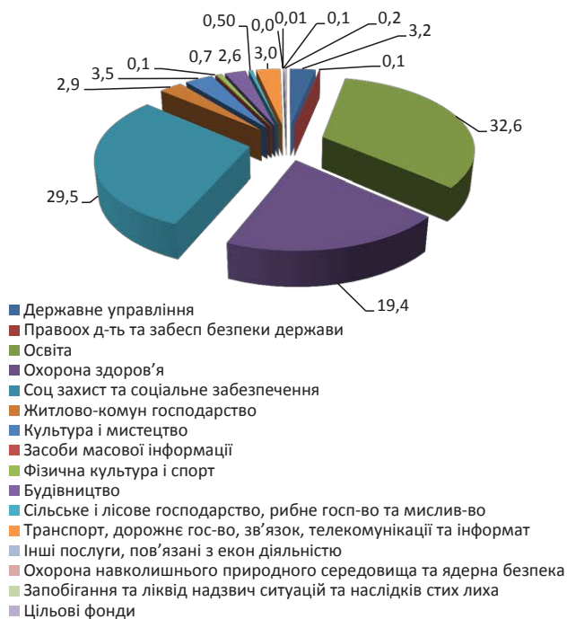
Рис. 2. Структура видатків місцевих бюджетів Чернівецької області за кодами функціональної класифікації, 2016 р. 1 , %

Частка видатків на транспорт, дорожнє господарство, зв'язок, телекомунікації та інформатику – 3,0%. Питома вага видатків на будівництво – 2,6%. Частка видатків на житлово-комунальне господарство – 2,9%.