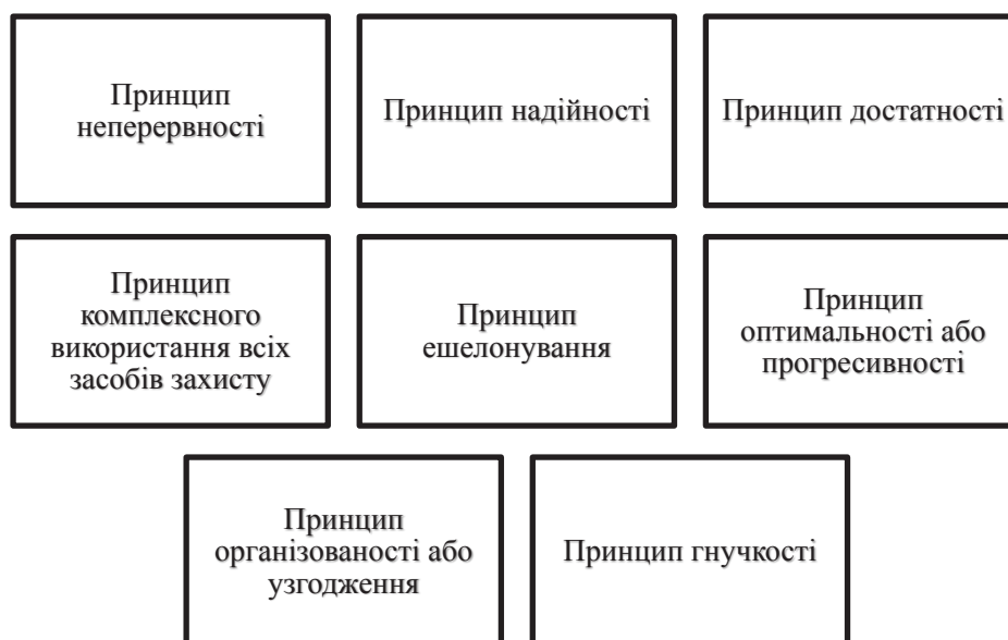
Рис. 1. Принципи побудови системи управління економічною безпекою підприємства

Принцип ешелонування впливає із зарубіжного досвіду застосування міжнародної системи економічної безпеки підприємства. Створення послідовних рубежів захисту і зон безпеки у комплексному використанні засобів і методів захисту дає змогу ство-