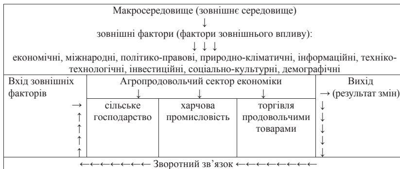
Рис. 2. Схема макросередовища агропродовольчого сектору економіки

Варто зазначити, що представники всіх чотирьох методичних підходів одноставно прийняли таку