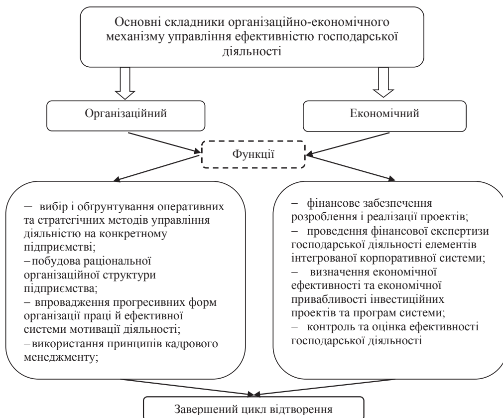
Рис. 1. Основні складники та функції організаційно-економічного механізму управління ефективністю господарської діяльності інтегрованих корпоративних систем

Що стосується методів організаційно-економічного механізму управління ефективністю господарської діяльності інтегрованих корпоративних