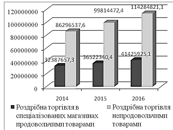
Рис. 1. Товарооборот продовольчих і непродовольчих товарів

Аналізуючи дані таблиці, можна простежити зростання всього товарообороту за основними групами протягом 2014-2016 рр. на 132,43%, у середньому зростання товарообороту щорічно становить 14,5% (рис. 1).