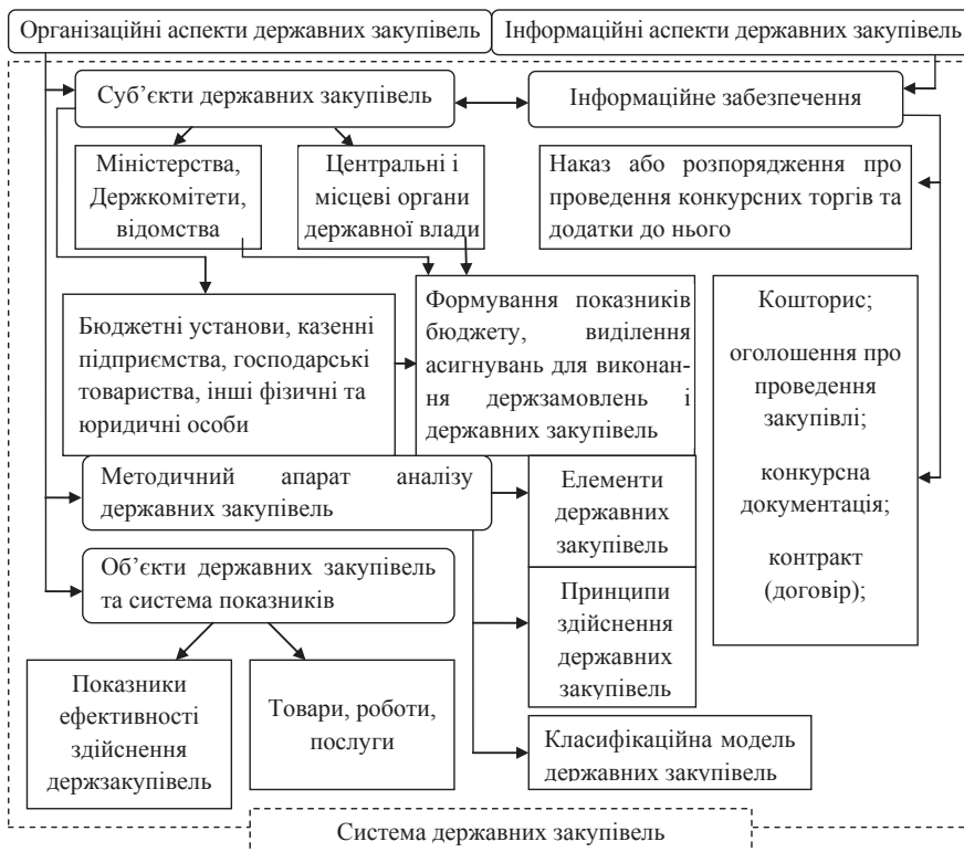
Рис. 2. Алгоритм організації державних закупівель товарів і послуг