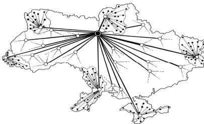
Рис. 2. Фрактальна структура підпорядкованості органів виконавчої влади в Україні (з чотирьох рівнів ієрархії показано два; для деяких територіально-адміністративних одиниць – три)

Розглядаючи організаційні аспекти правової системи, можна спостерігати фрактальну структуру підпорядкованості органів виконавчої влади в Україні (рис. 2).