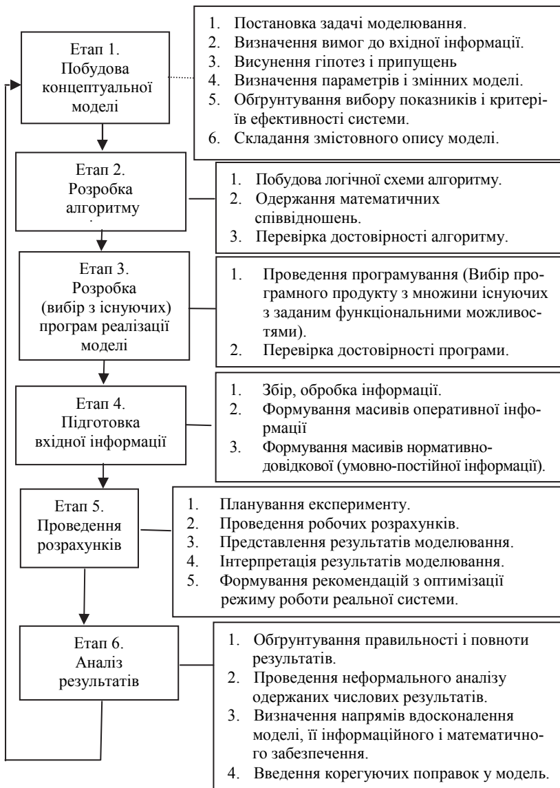
Рис. 1. Послідовність розробки моделі системи фінансової безпеки підприємства