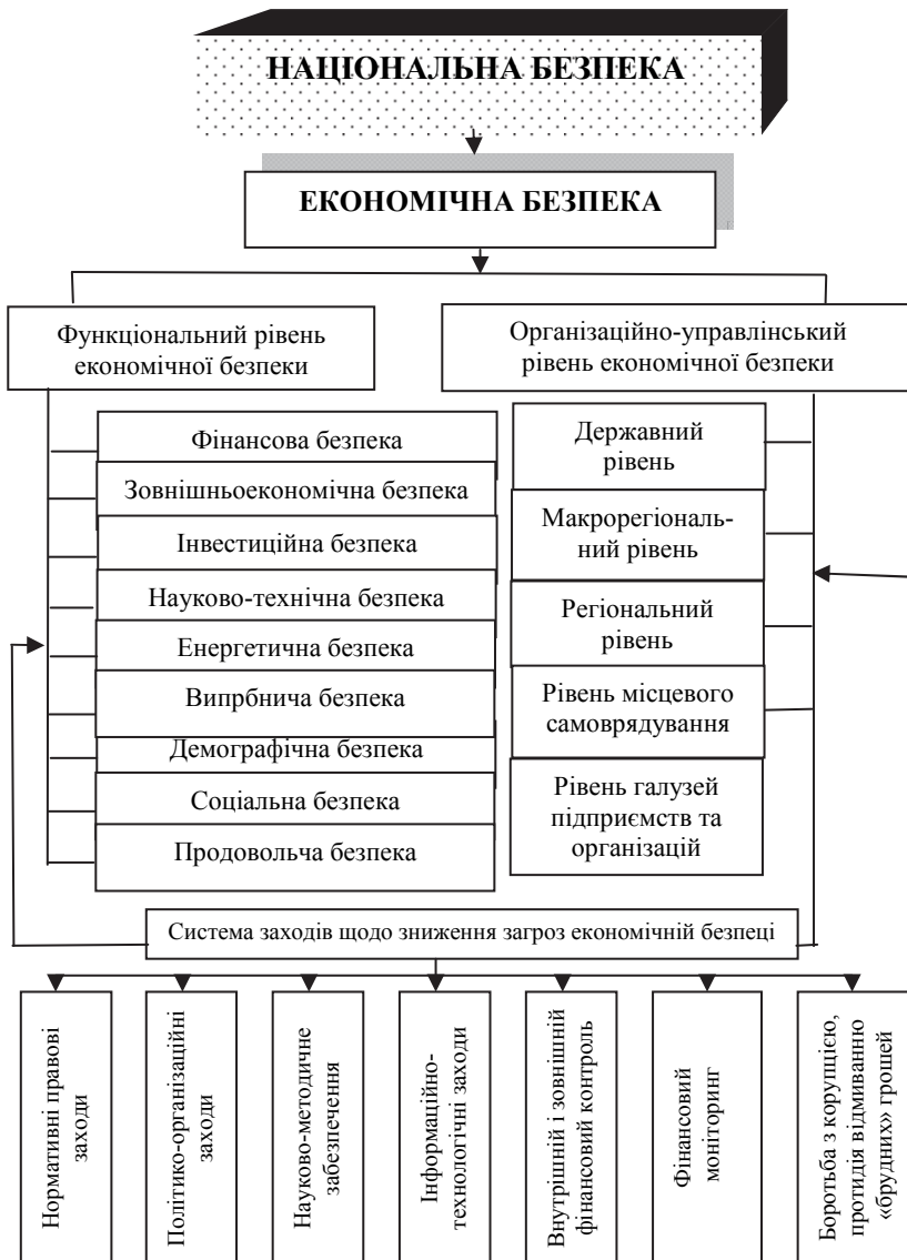
Рис. 1 Структура економічної безпеки та заходи щодо її посилення