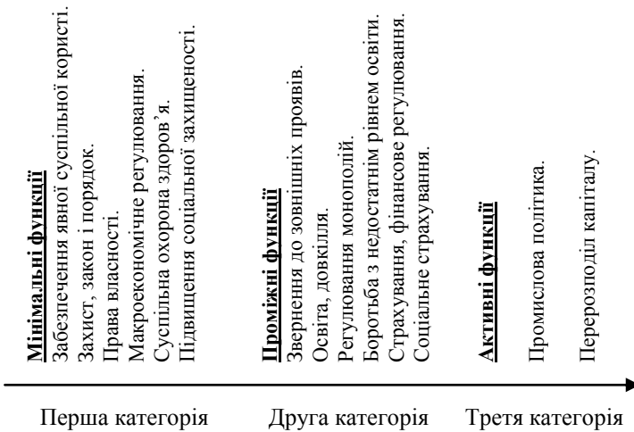
Рис. 2. Сфера впливу функцій держави

ренні будь-якого суспільства і будь-якої економіки, яка працює ефективно – і гуманно» [4, с. 209]. У новітній статті він наголошує на тому, що саме політика нерегульованого ринку Р. Рейгана у США у кінцевому підсумку і спричинила сучасну глобальну рецесію [5]. Сьогодні науковці все частіше говорять про необхідність розбудови «сильної держави». Американський науковець Ф. Фукуяма написав книжку під такою назвою [6, с. 220]. В ній проводиться думка, що глобалізація та розлади світової економіки вимагають активізації регуляторної функції держави, зокрема проведення промислової та структурної політики. Доповідь Світового банку про світовий розвиток – 1997 під назвою «Держава у світі, що змінюється» присвячена проблемі підвищення ефективності діяльності держави. Лейтмотивом доповіді є теза, що без ефективної держави стійкий розвиток – економічний і соціальний – є неможливим [7, с. 4]. Представлено три категорії функцій, що їх виконує (може чи повинна виконувати) держава (рис. 2).