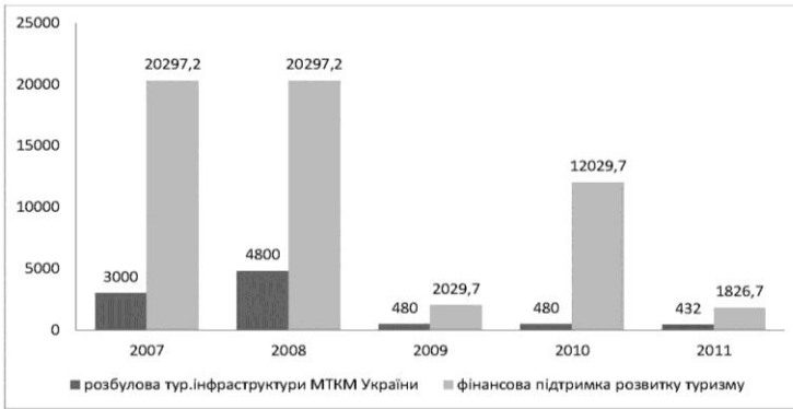
Рис. 1. Фінансування туризму в 2007–2011 рр. за рахунок коштів державного бюджету України