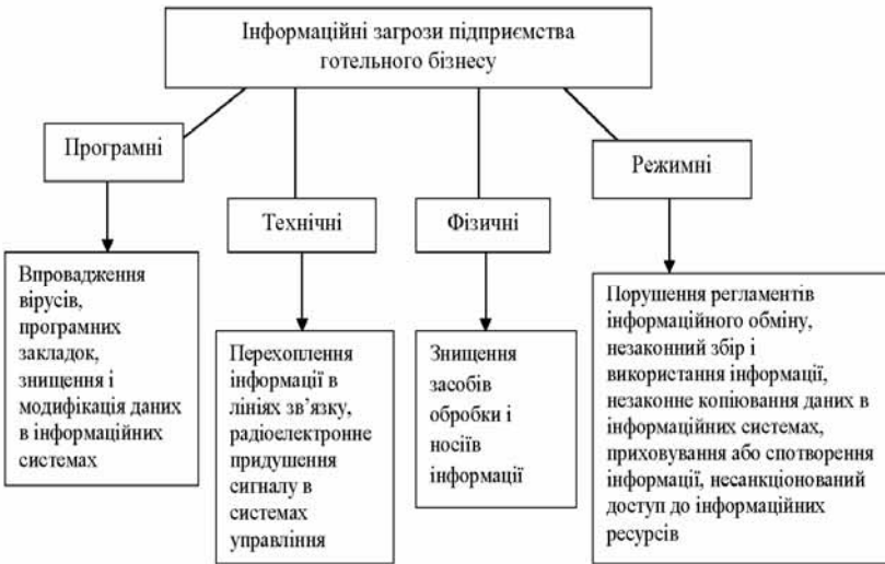
Рис. 2. Основні групи інформаційних загроз підприємства готельного бізнесу

У зв'язку з погіршенням таких складових інформаційних ресурсів, як конфіденційність, цілісність, доступність і достовірність, спостерігаються збої у функціонуванні систем управління, розголошуються відомості, що становлять комерційну таємницю, порушується достовірність фінансової документації [4, с. 126]. Основні інформаційні загрози представлені на рис. 2.