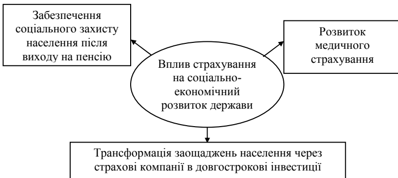
Рис. 1. Основні напрями впливу страхування на соціально-економічний розвиток держави

Так, для України, як і для інших країн Європи, актуальною є проблема скорочення населення. У більшості розвинених країн на одну людину старше 65 років припадає 4–5 осіб працездатного віку, але до 2025 р. це співвідношення складе в країнах Європи 1:2,5, у США – 1:3,5. За прогнозами до 2050 р. кількість населення Європейського