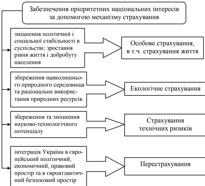
Рис. 2. Забезпечення пріоритетних національних інтересів за допомогою механізму страхування

Серед пріоритетів національних інтересів у контексті явища, яке досліджується, можна виокремити: 1) зміцнення політичної та соціальної стабільності в суспільстві; зростання рівня життя і добробуту населення; 2) збереження навколишнього природного середовища та раціональне використання природних ресурсів; 3) збереження та зміцнення науково-технологічного потенціалу; 4) інтеграція України в європейський політичний, економічний, правовий простір та в євроатлантичний безпековий простір (рис. 2).