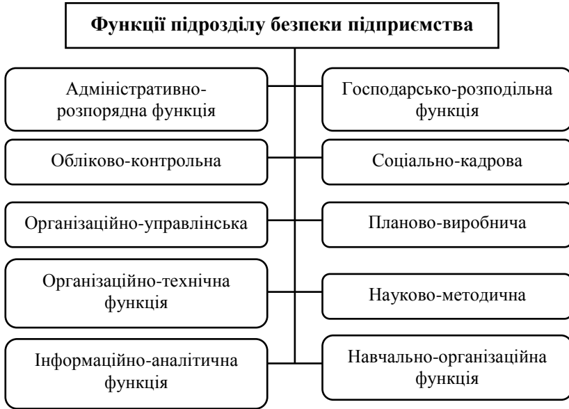
Рис. 1. Функції підрозділу безпеки