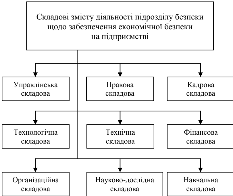
Рис. 3. Складові змісту діяльності підрозділу безпеки щодо забезпечення економічної безпеки на підприємстві

Слід враховувати, що зміст діяльності фахівців підрозділу безпеки підприємства, визначення суб'єктів її забезпечення залежать від поглядів власника підприємства щодо його діяльності та розвитку. У сучасних словниках суб'єкт трактується як особа (фізична або юридична), якій належать ті чи інші права та обов'язки, або носій дій, той, хто пізнає, мислить та діє [11]. Тобто суб'єктом забезпечення безпеки на підприємстві може бути особа (фізична або юридична), яка має певні права, обов'язки щодо здійснення заходів із безпеки на підприємстві.