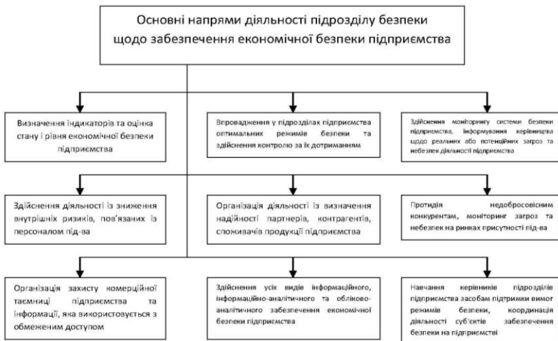
Рис. 2. Основні напрями діяльності підрозділу безпеки щодо забезпечення економічної безпеки підприємства