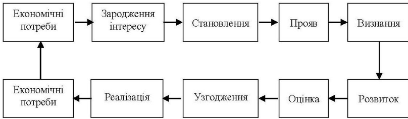
Рис. 2. Процес формування економічного інтересу [8, с. 366]

Виникнення економічних потреб – перший крок на шляху формування економічного інтересу. Наступний етап – зародження, що характеризує усвідомлення економічного інтересу. Відтак відбувається становлення інтересу. Важливим етапом формування економічного інтересу є його визнання, тобто внутрішнє визнання суб’єктом наявності власного економічного інтересу. Цей процес супроводжується розвитком інтересу.