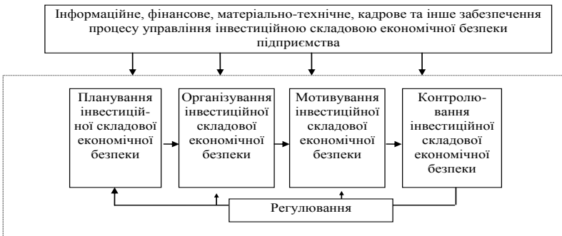
Рис. 3. Модель управління інвестиційною складовою економічної безпеки підприємства на засадах функціонального підходу

Управління інвестиційною складовою економічної безпеки – це комплекс дій, спрямованих на забезпечення досягнення її мети (підвищення рівня безпеки, розвитку об'єкту інвестування, отримання прибутку (доходу) чи іншого позитивного ефекту). На основі узагальнення літературних джерел та вивчення існуючого досвіду управління нами розроблена модель управління інвестиційною складовою економічної безпеки підприємства на засадах функціонального підходу (див. рис. 3).