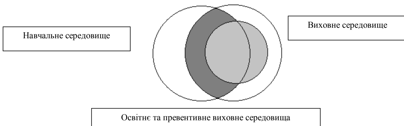
Рис. 2. Схема відношення освітнього, виховного та превентивного виховного середовищ (превентивне виховне середовище позначено світло-сірим кольором)

Отже, превентивне виховне середовище можна визначити як упорядковану цілісну сукупність організаційно-педагогічних умов, взаємодія й інтеграція яких запобігає негативним впливам соціуму, сприяє виробленню ціннісного ставлення до себе, природи й суспільства, допомагає розкриттю внутрішнього потенціалу й самореалізації особистості. Уважаємо, що відношення між освітнім і превентивним виховним середовищами такі: превентивне виховне середовище – частина виховного загалом, превентивне середовище суцільне виховному. Водночас превентивне виховне середовище ширше за освітнє (відношення часткового збігу) (рис. 2).