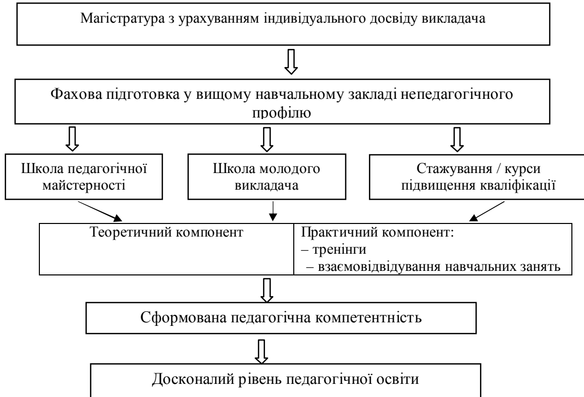
Рис. 2. Модель компетентнісного зростання (без відриву від викладацької діяльності)

Модель компетентнісного зростання (без відриву від викладацької діяльності) ми пропонуємо для викладачів вищих навчальних закладів непедагогічного профілю, які через об'єктивні причини не здобули спеціальної підготовки за напрямом «Педагогіка вищої школи».