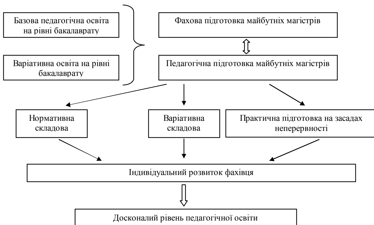
Рис. 3. Комплексна модель педагогічної освіти магістрантів вищих навчальних закладів непедагогічного профілю

Найбільш ефективною моделлю педагогічної освіти магістрантів вищих навчальних закладів непедагогічного профілю є, на нашу думку, комплексна модель, яка ґрунтується на базовій і варіативній складових освіти, яку здобули студенти на етапі їх навчання на бакалавраті (рис. 3.).