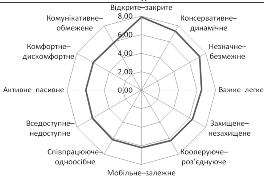
Рис. 2. Базові біполярні шкали оцінювання ефективності спроектованого ХОНС