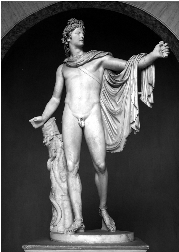
Рис. 1. Аполлон Бельведерський. Римська мармурова копія бронзового оригіналу роботи давньогрецького скульптора Леохара (бл. 330 рр. до н. е.)

Аполлон доволі рано змужнів. На четвертий день після народження, він зміг вбити змія Піфона, який спустошував околиці Дельф. Там він створив свій оракул і заснував на свою честь Піфійські ігри. Юному богу довелося отримати очищення від вбивства у Темпейській долині (Фессалія). Після цього, він був прославлений жителями Дельф [7, 140; 18, 12]. Коли Аполлону виповнилося чотири роки, він почав будувати храм на Делосі з рогів ланей, яких вбила Артеміда [14, 60]. Бог сонця швидко набирився сил. Він вразив своїми стрілами велетня Тітія, котрий хотів образити Лето, циклопів, що кували блискавки Зевсу, а також приймав участь у небезпечних битвах олімпійців з гігантами і титанами. Стрілу, якою були вбиті циклопи, Аполлон перетворив на сузір'я [27, 29]. Як стверджують Гесіод і Акусілай, Зевс збирався скинути його в Тартар, у глибоку прірву, що знаходиться під царством Аїда, але Лето переконала відправити сина на служіння людям. Аполлон був відданий у пастухи царю Фессалії, Адмету. Юний бог сонця примножив