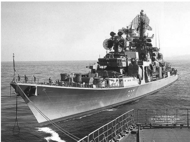
Фото 4 – Великий протичовновий корабель «Очаків»

Перший бойовий вихід в Середземне море здійснив з 24 грудня 1974 року по 12 травня 1975 року, з заходом в Аннабу (Алжир). За період служби корабель зробив дев'ять бойових походів, брав участь у навчаннях «Океан-75», «Крим-76». Нагороджений вимпелом міністра оборони СРСР «За мужність і військову доблесть». У 1977, 1979 і 1986 роках