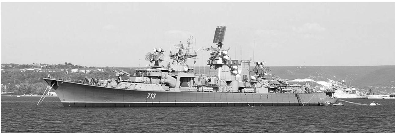
Фото 3 – Сторожовий корабель «Комсомолец України»

Під час бойової служби у 1983–1984 роках двічі виконує завдання корабля радіолокаційної варти у зоні бойових дій під час війни в Лівані. Через рік бере участь у навчаннях «Граніт-85». «Комсомолец України» був учасником навчань спільної ескадри із заходом у порти Созополь, Бургас, які проходили з 12 по 27 червня 1986 року. 18–22 листопада 1986 року відвідує грецький порт Пірей, 17–21 листопада 1987 року – Туніс та з 28 червня по 2 липня 1986 року турецьке місто Стамбул [1].