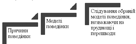
Рис. 1. Мотивація дорослої людини Джерело [11, с. 121–122]: Williams, M. and R. Burden. 1997. Psychology for Language Teachers. CUP.

Схематично мотивацію можна представити так: (Рис. 1):