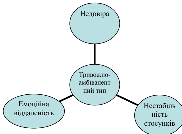
Рис. 3. Взаємозв'язок тривожно-амбівалентного типу прив'язаності та взаємостосунків між подружжям ( n = 60 ; %)

ра у стосунках – від захопленості партнером, нев'язливості до ревнощів та конфліктів. Наочно дані представлені на рис. 3