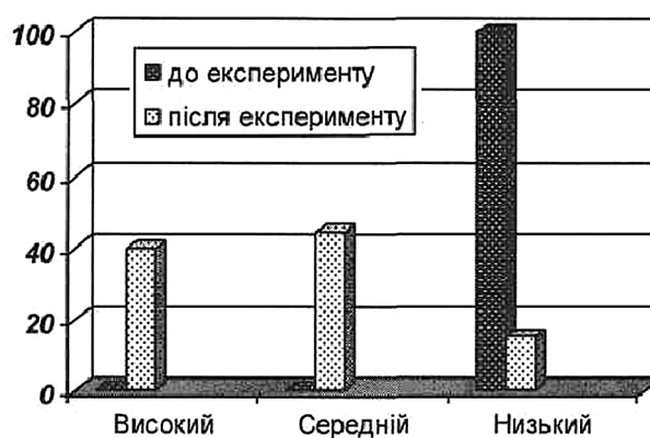
Рис. 3. Зміни рівнів суб'єктності студентів контрольної групи до та після формувального експерименту

За допомогою методу парних порівнянь виявлено статистично значущу різницю між відсотковими показниками рівня розвитку професійної суб'єктності майбутніх правників, що свідчить про доцільність подальшого впровадження представленої авторської програми у практику професійної підготовки у вищому навчальному закладі.