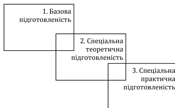
Рис. 2. Модель складників фахової підготовленості (за Н. В. Синельниковою)

Ю. М. Швалб наголошує, що спеціальна теоретична підготовка повинна відбуватися у формі навчального тренінгу. Навчальні тренінги визначаються Н. О. Євдокимовою як спеціально-організовані дії з моделювання навчальних ситуацій з метою формування базових понять і компетенцій на основі проблематизації індивідуального досвіду учасників. Навчальний тренінг, створюючи ігрову реальність, знімає бар'єри на шляху креативності мислення, страх помилки (оскільки ситуація несправжня) і дозволяє вирішувати цілком реальні проблеми, пов'язані з майбутньою професійною діяльністю. Використання навчального тренінгу як форми роботи