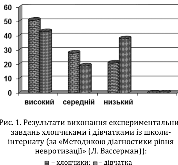
Рис. 1. Результати виконання експериментальних завдань хлопчиками і дівчатками із школи-інтернату (за «Методикою діагностики рівня невротизації» (Л. Вассерман)):

Слід відзначити загальну високу невротизацію у досліджуваних обох статей (показник «високий рівень невротизації»: хлопчики – 51%; дівчатка – 43%), що засвідчує не лише про типові загальновікові підліткові проблеми (кризовий перехідний характер віку, пубертат, конфліктність і нонконформізм як ознаки почуття дорослості, розлади і дисфункції у побудові «Я-концепції» тощо), але й про