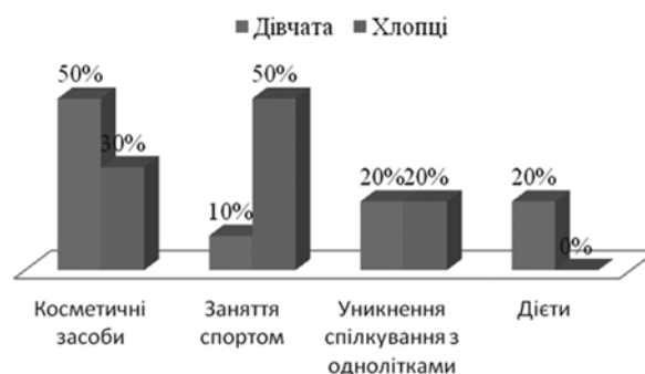
Рис. 2. Гендерної відмінності у вчинках підлітків