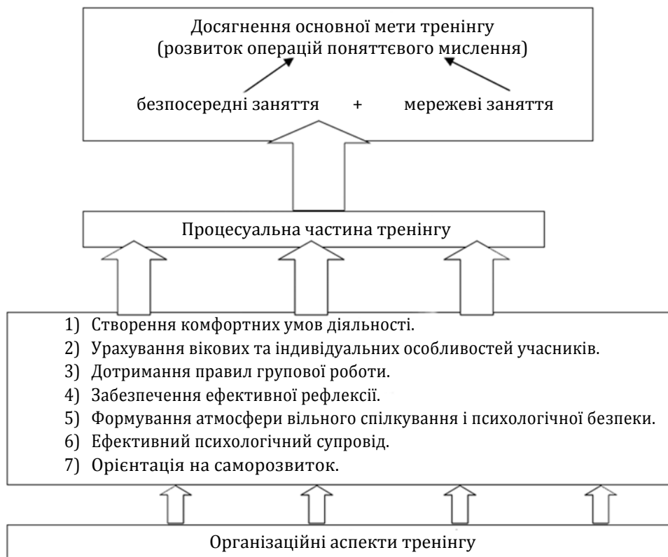
Рис. 2. Модель комбінованого тренінгу поняттєвого мислення

Варто також згадати, що нині активно досліджують психологічні аспекти використання інформаційних технологій в освітньому процесі (зокрема, дистанційне та комбіноване навчання). Група науковців під керівництвом М. Л. Смульсон, вивчаючи цю проблему, дійшла таких висновків: 1) групова навчальна і психологічна робота, що здійснюється через Інтернет, є можливою і може бути ефективною при дотриманні певних умов; 2) необхідною умовою такої роботи є створення віртуального освітнього середовища – спеціально створеного контенту інформаційного простору Інтернету, що забезпечує