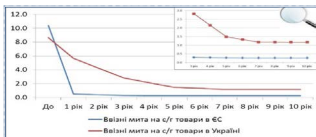
Рис. 1. Ввізні мита України та країн ЄС на сільськогосподарську продукцію та харчові товари

періоди тривалістю від 1-го до 7-и років, на 9,8% – часткову лібералізацію та на 3,0% – безмитні тарифні квоти. Така тактика означає надання особливо чутливим секторам, зокрема агропромисловій сфері та ринку свинини, більше часу для адаптації до більш конкурентоспроможного середовища, надаючи споживачеві більший вибір продуктів за нижчими цінами. Передбачено встановлення перехідних періодів тривалістю від 3-х до 7-и років на 2% тарифних ліній, а за найбільш чутливими товарами, до яких належить свинина, запропоновано доступ в рамках безмитних тарифних квот [15]. Саме з боку нашої держави експортні мита скасовуватимуться поступово протягом 10 років (рис. 1).