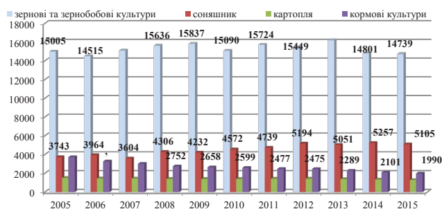
Рис. 2. Посівні площі основних сільськогосподарських культур, тис. га

На рис. 2 наведено динаміку структури посівних площ основних сільськогосподарських культур в Україні за 2005–2015 рр. Його аналіз свідчить про те, що посівні площі всіх основних культур (зернових, картоплі, кормових, а також соняшнику) зазнали скорочення. Серед факторів, які обумовили цю тенденцію, треба виділити втрату значної кількості посівних площ на територіях Луганської та Дніпропетровської областей, а також на території Криму.