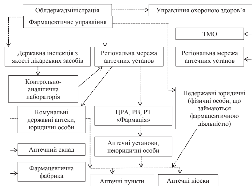
Рис. 1. Організаційна структура фармацевтичної галузі на рівні області [15]

Як видно з представлених даних, обсяги виробництва та реалізації фармацевтичних продуктів, препаратів та матеріалів у 2017 р. значно збільшилися: вони перевищують не тільки відповідні показники за вісім місяців 2016 р., а й загальні результати діяльності 2016 р. Одночасно із цим позитивним зрушенням є збільшення обсягів реалізації продукції за межі країни в 2017 р. проти 2016 р.