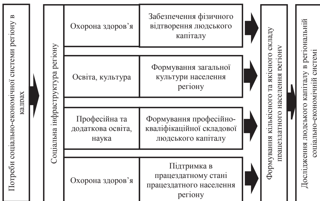
Рис. 1. Роль та функції соціальної інфраструктури регіону щодо формування людського капіталу