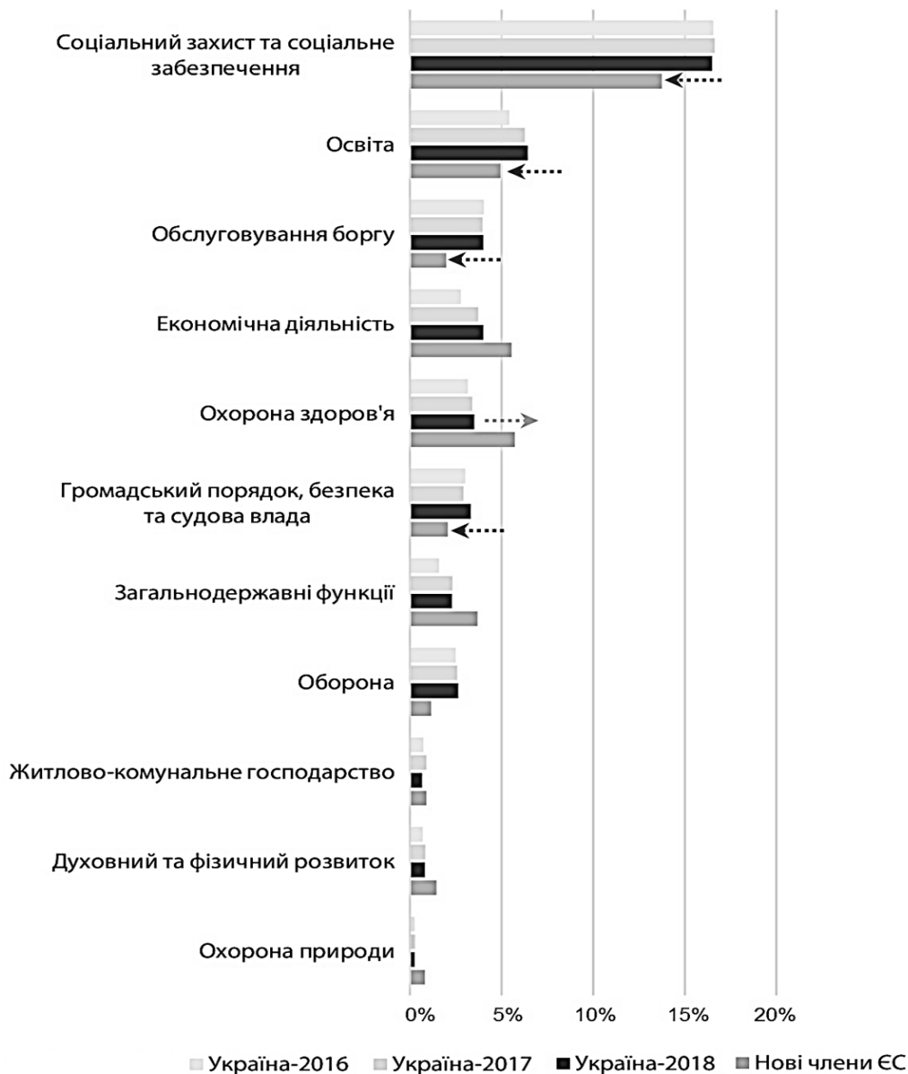
Рис. 2. Державні витрати* України та країн – нових членів ЄС, % від ВВП

Незважаючи на це, проблема недосконалості системи оцінювання діяльності державних органів виконавчої влади в галузі забезпечення відкритості інформації щодо