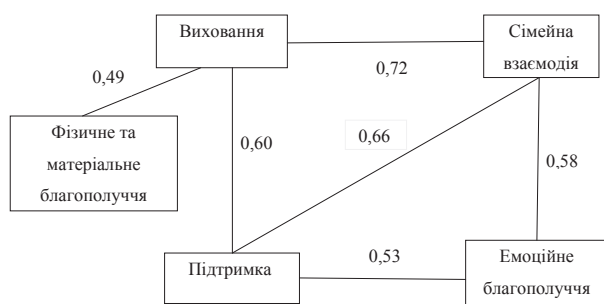
Рис. 2. Кореляційна плеяда показників якості життя та соціального функціонування сімей, що виховують дітей з синдромом Дауна

Було встановлено, що показники «сімейна взаємодія», «виховання» та «підтримка» мають найбільшу кількість кореляційних зв'язків. Так, для виховання та достатньої опіки за дитиною важливі три складові – це матеріальне благополуччя, сімейна взаємодія та підтримка сім'ї, пов'язана із інвалідністю дитини, участь сім'ї у соціальних проектах та програмах раннього втручання. У свою чергу, програми раннього втручання мають позитивний вплив як на виховання дитини, так і на поліпшення сімейної взаємодії та емоційного благополуччя батьків.